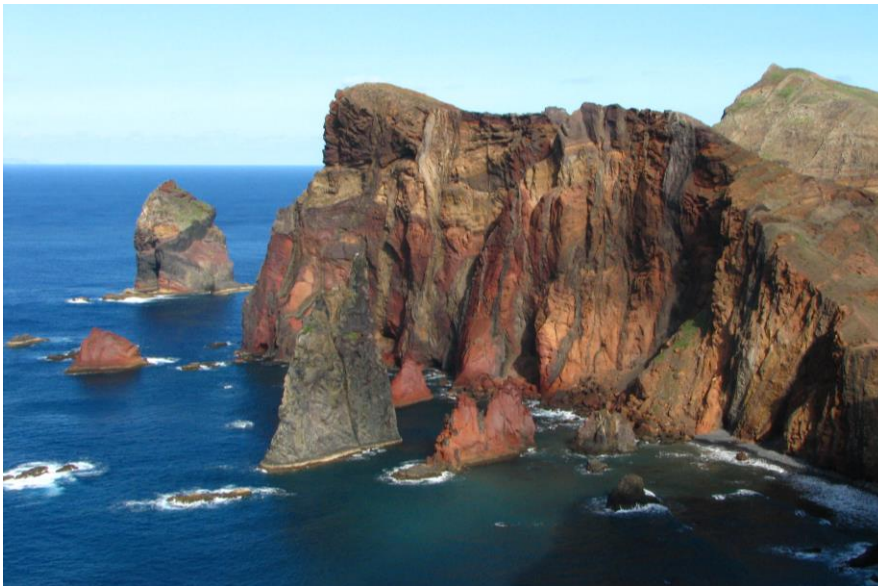
Obr. 3: Pobřeží