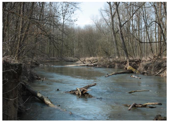
Obr. 2: Říční pochody