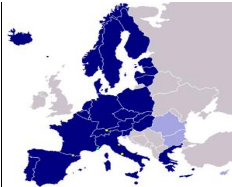
Obrázek č. 1

Základní body Shengenské dohody jsou: zrušení kontrol na hranicích mezi členskými zeměmi, dále soudní policejní spolupráce, zajištění mezinárodního sledování činnosti kriminálních skupin či jednotlivců, zavedení jednotné podoby víz, společná azylová politika, Shengenský informační systém a konzulární práce. Poslední rozšíření proběhlo v roce 2007.