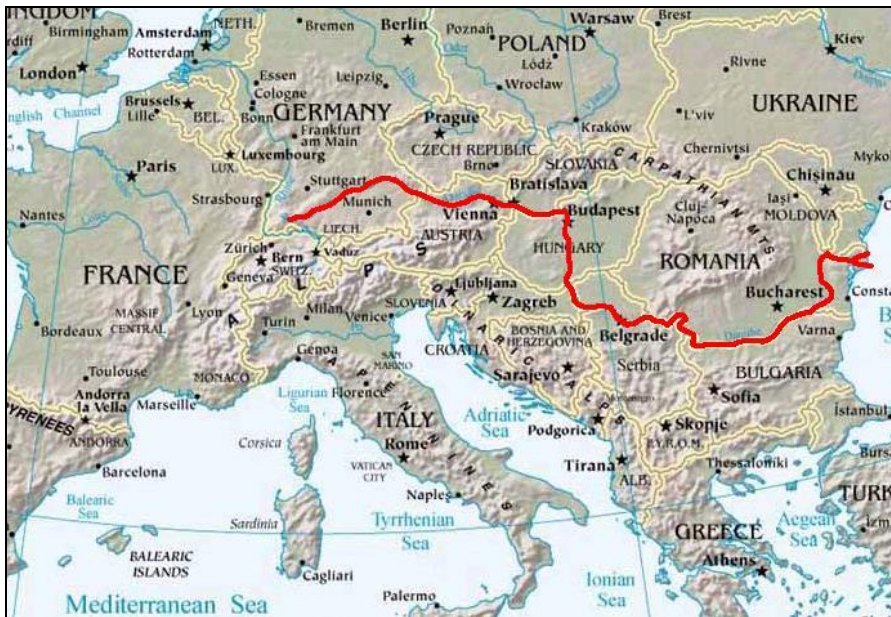
Obrázek č. 4

b) UMĚLÉ HRANICE - stanovení hranic bylo v dějinách a je i v současnosti předmětem sporů mezi státy. Vymezení území státu je vždy aktuálním problémem při vzniku nového útvaru. Uplatňuje se hledisko historické , které vychází z dříve existujících celků nebo hledisko národnostní , kdy se základ bere území obývané určitým národem nebo národy. V některých případech se hlediska kombinují.