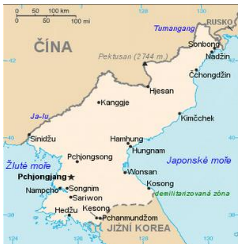
Obrázek č.3

2. oddělující funkce - demarkační linie – oddělují od sebe zneprátelené strany po uzavření příměří až do určení státní hranice ( Jižní a Severní Korea – „ 38. rovnoběžka “)