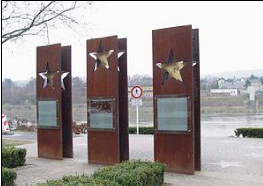
Obrázek č. 7: