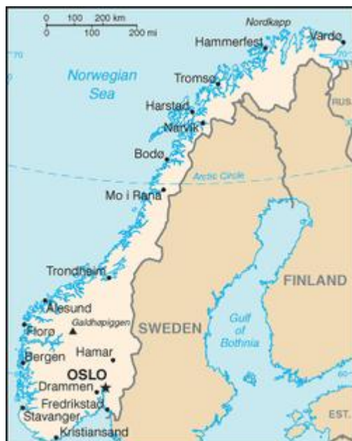
Obrázek č. 6:

Z tohoto hlediska mělo Československo tvar území nevýhodný, protáhlý, s dlouhou hranicí. (viz obrázek č. 8) Česká republika má v dnešní době tvar výhodnější.