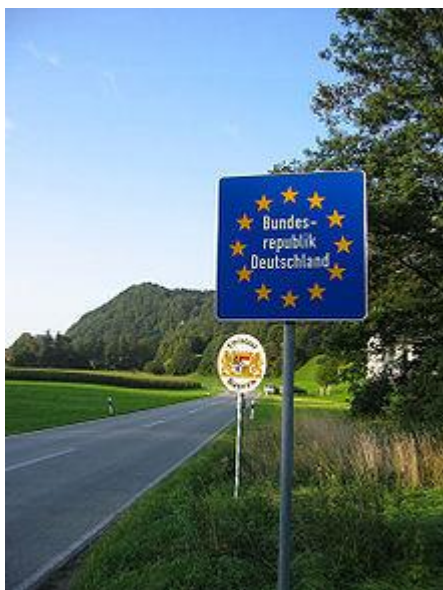
Obrázek č. 2

Typická schengenská hranice - žádná pasová kontrola mezi Německem a Rakouskem, jen cedule vítající návštěvníka.