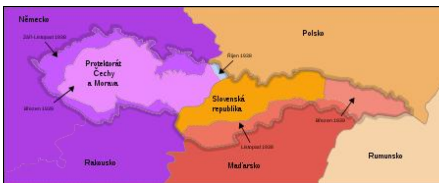
Obrázek č. 8:

Při stanovení hranic Československa po rozpadu Rakouska – Uherska v roce 1918 bylo nutné stanovit kritéria vymezení území nového státu na mapě Evropy. Bylo kombinováno hledisko historické – hranice českých zemí, severní hranice bývalých Uher a požadavek přírodních hranic – okrajová pohoří, vodní toky. Ale nebylo uplatněno hledisko národnostní, což znamená, že v pohraničních oblastech Čech, Moravy a Slezska převládalo německé obyvatelstvo a na jihu Slovenska Maďaři. Požadavek oddělení území obývaných Němci a Maďary a jejich připojení k Německu a k Maďarsku vedl k Mnichovské dohodě v roce 1938 a ke změně hranic. Návrat k předválečným hranicím Československa (kromě Podkarpatské Rusi připojené k SSSR) byl spojen se snahou vytvořit hranici státu i hranicí národnostní. To vše za tehdejších politických poměrů vedlo po 2. světové válce k vysídlení německého obyvatelstva z ČSR - 1945 – 1946.