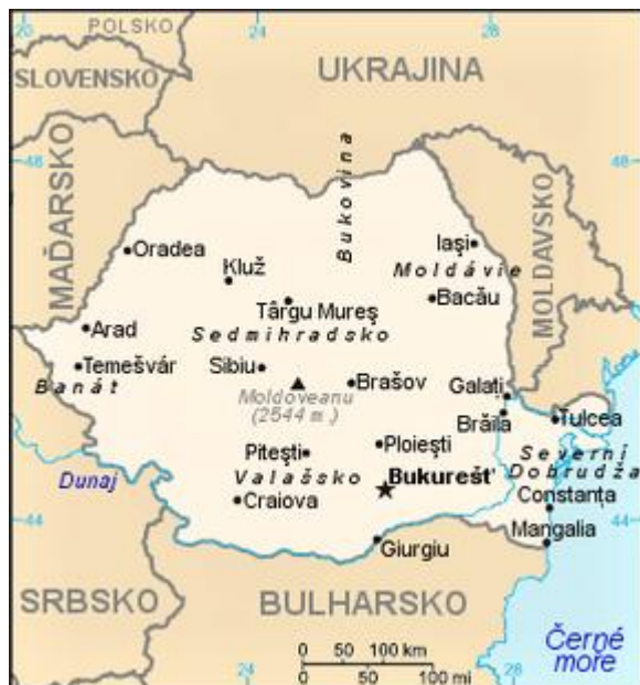
Obrázek č. 5: