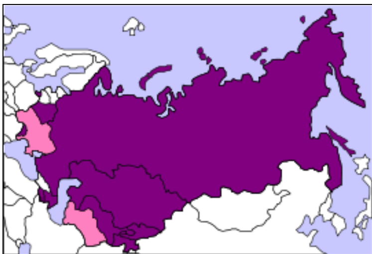
Obrázek č. 3: