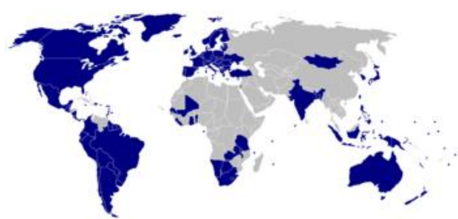
Obrázek č.3:

20. Státy složené se člení na menší celky. Federace mají různé názvy, jak se nazývají jednotlivé menší útvary těchto federací: Brazílie, Indie, Austrálie, Kanada, Rakousko, SRN, USA?