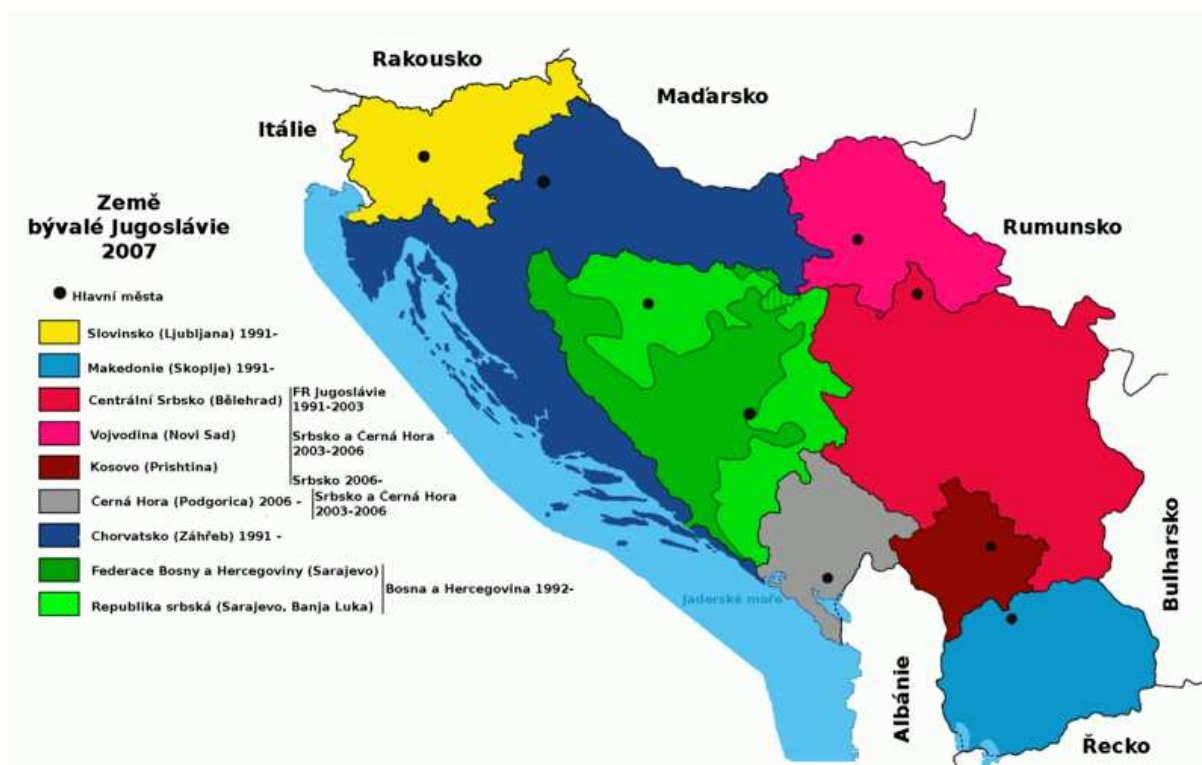
Obr. 1: Země bývalé Jugoslávie

Po vyhlášení nezávislosti Republiky Makedonie (1991) Řecko vzneslo požadavek na změnu jejího názvu. Makedonie byla přijata do OSN až v roce 1993 pod názvem Bývalá jugoslávská Republika Makedonie (FYROM) , která byla v roce 1995 po částečné úpravě státní vlajky uznána i Řeckem. Problém albánské menšiny se projevil v roce 1992 ilegálním referendem o autonomii pro Albánce v Makedonii, následným (2001) albánským povstáním, které bylo potlačeno za pomoci NATO. V současnosti je postavení Makedonců i Albánců rovnoprávné.