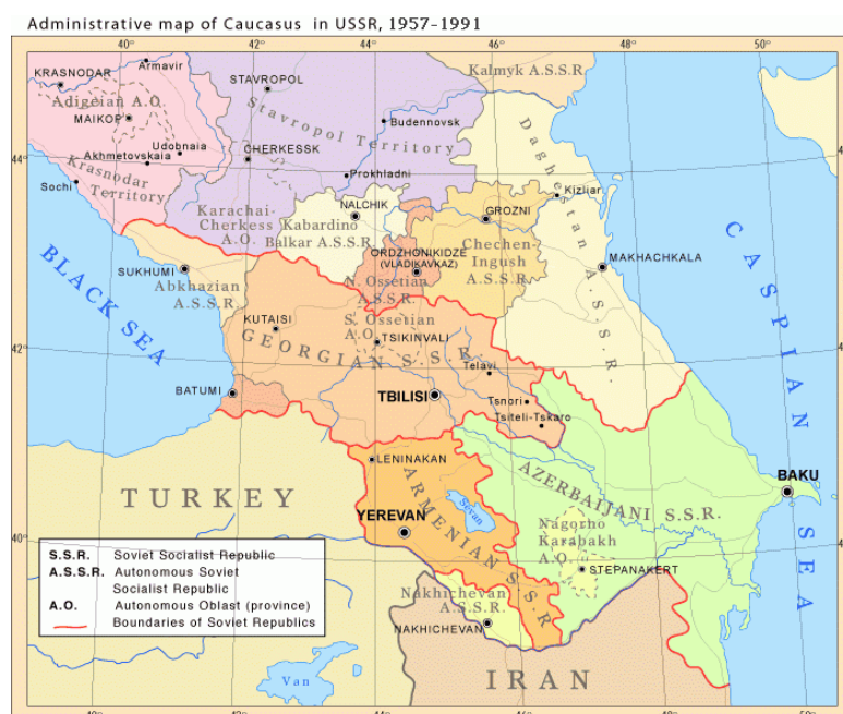
Obr. 1: Oblast Zakavkazska v období SSSR

V letech 1988 až 1994 probíhala mezi Arménií a Ázerbájdžánem válka o Náhorní Karabach, v letech 1992 až 1994 spory o Abcházii a Jižní Osetii v Gruzii a v roce 2008 došlo k ruskogruzínskému konfliktu o tyto oblasti.