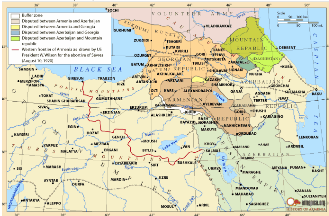
The First Armenian Republic, 1918-1920

1918 (únor až květen) Zakavkazská demokratická federativní republika 1918 – 1920/21 samostatné republiky Arménie, Ázerbajdžán, Gruzie