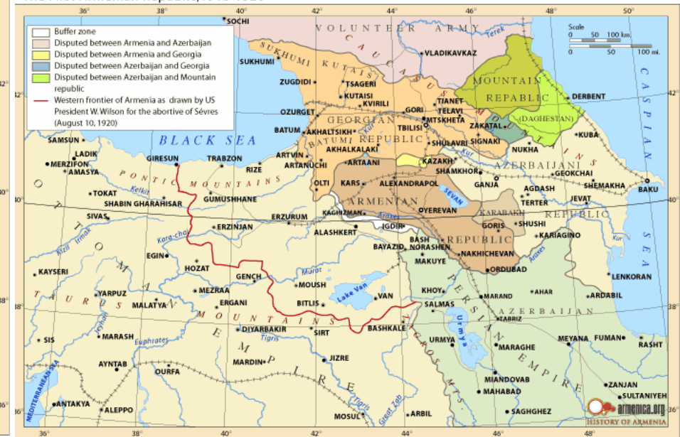
The First Armenian Republic, 1918-1920