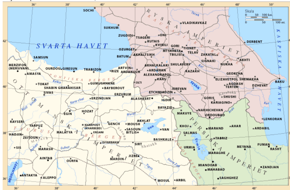
Ryska expansionen in i Kaukasus, 1878-1914