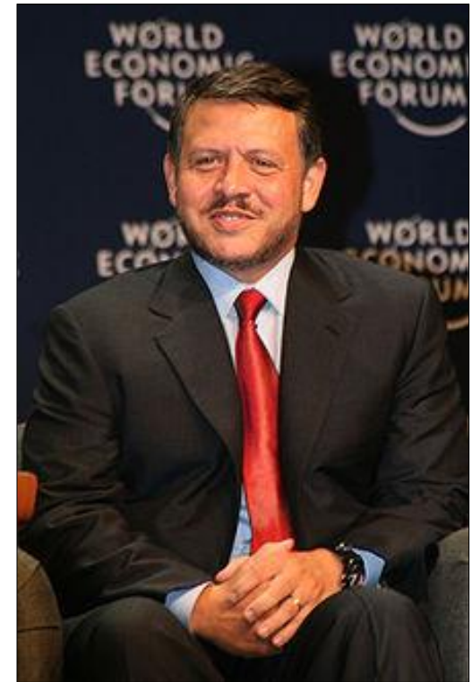
Král Abdalláh II.