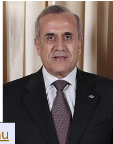
12. prezident Libanonu