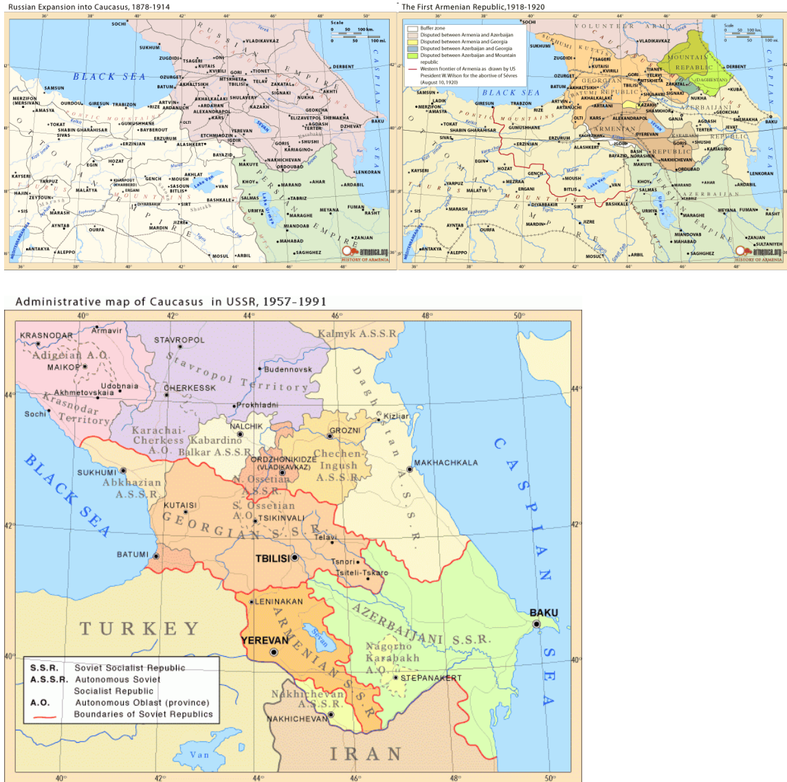
Obrázek 4: Historický vývoj Zakavkazska

9) S pomocí mapek popište, jak se změnila politická mapa Zakavkazska: