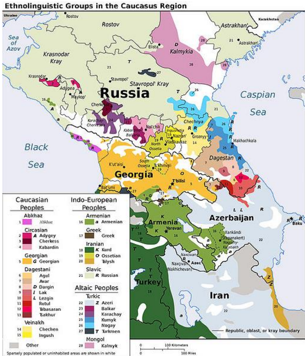
Obrázek 3: Národnostní složení Zakavkazska

8) Popište národnostní složení, jazyky, typy písma a náboženské vyznání v jednotlivých státech Zakavkazska: