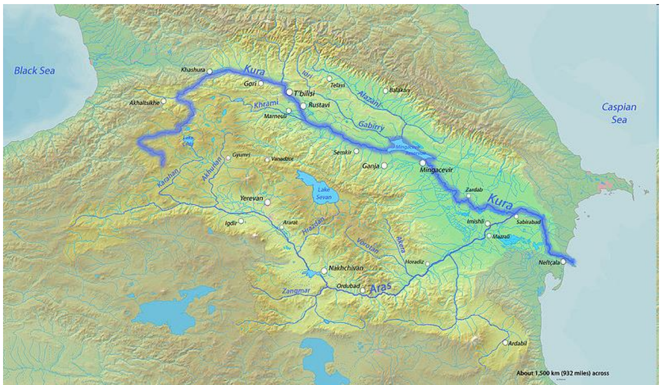
Obrázek 1: Povodí Kury