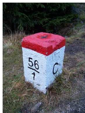
Obr. 3: Schengenský prostor