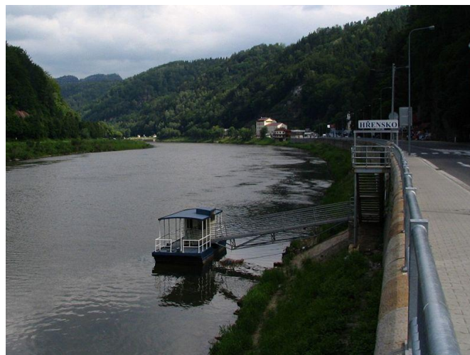
Obr. 2: Nejvyšší a nejnižší místo ČR