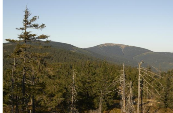
Obr. 4a,b: Smrkový les