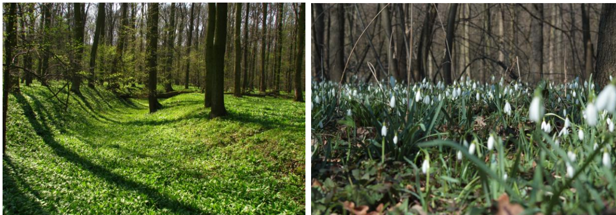
Obr. 2a,b: Lužní les

a) Kde se v ČR vyskytují lužní lesy ? Lokalizujte na mapě oblast soutoku Moravy a Dyje a Litovelské Pomoraví (1, 2).