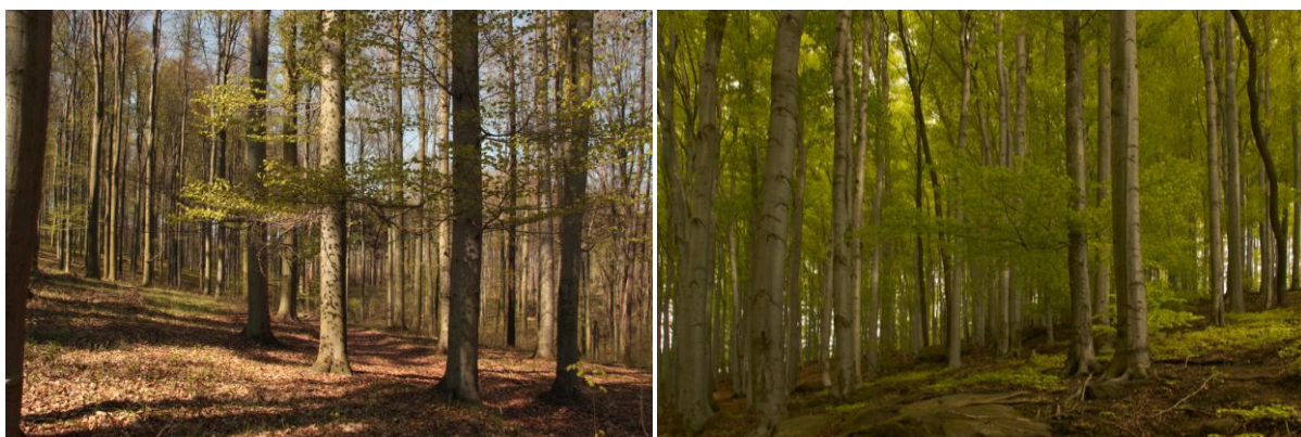
Obr. 3a,b: Bukový les

c) Stupně pahorkatin až vrchovin: buko-dubový, dubo-bukový, bukový, jedlo-bukový jsou částečně využívány zemědělsky, ve vyšších polohách převažují lesy, nyní však většinou smrkové.