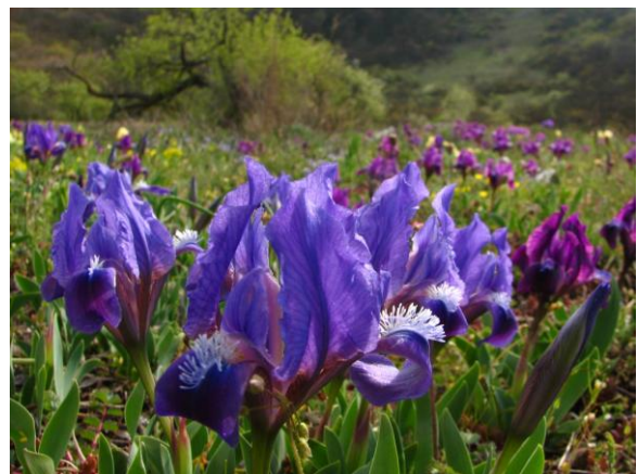
Obr. 5a,b: Stepní rostlinstvo