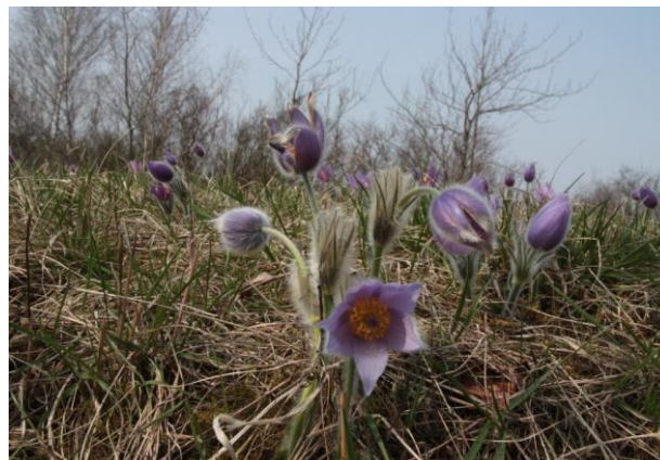
Obr. 5a, b: PP U strejčkova lomu ( 1 , 2 )