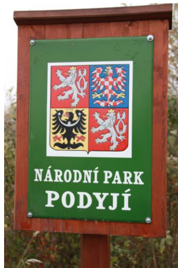
Obr. 3a, b: NP Podyjí ( 1 , 2 )