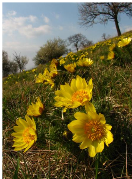
Obr. 4a, b: PR Horky u Mílotic ( 1 , 2 )