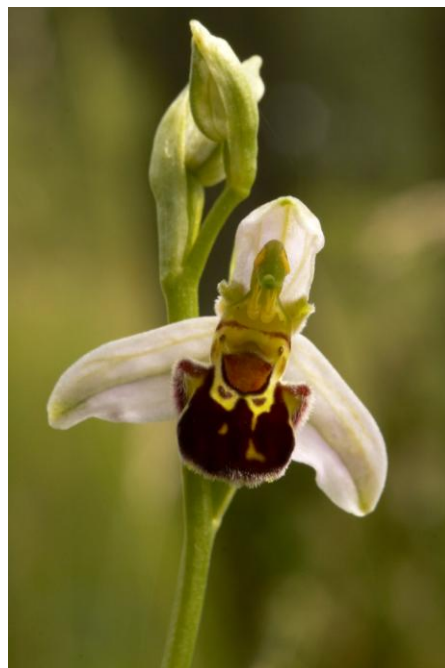
Obr. 1a, b: NPR Čertoryje v CHKO Bílé Karpaty ( 1 , 2 )