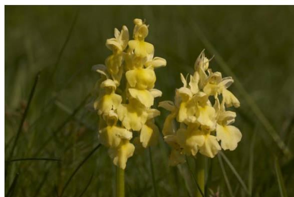
Obr. 2a, b, c: PP Stráň v přírodním parku Hostýnské vrchy ( 1 , 2 )

Digitální učební materiál byl vytvořen v rámci projektu Inovace a zkvalitnění výuky na Slovanském gymnáziu CZ.1.07/1.5.00/34.1088