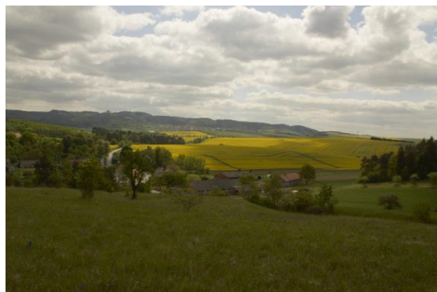
Obr. 1a,b: Venkovské osídlení