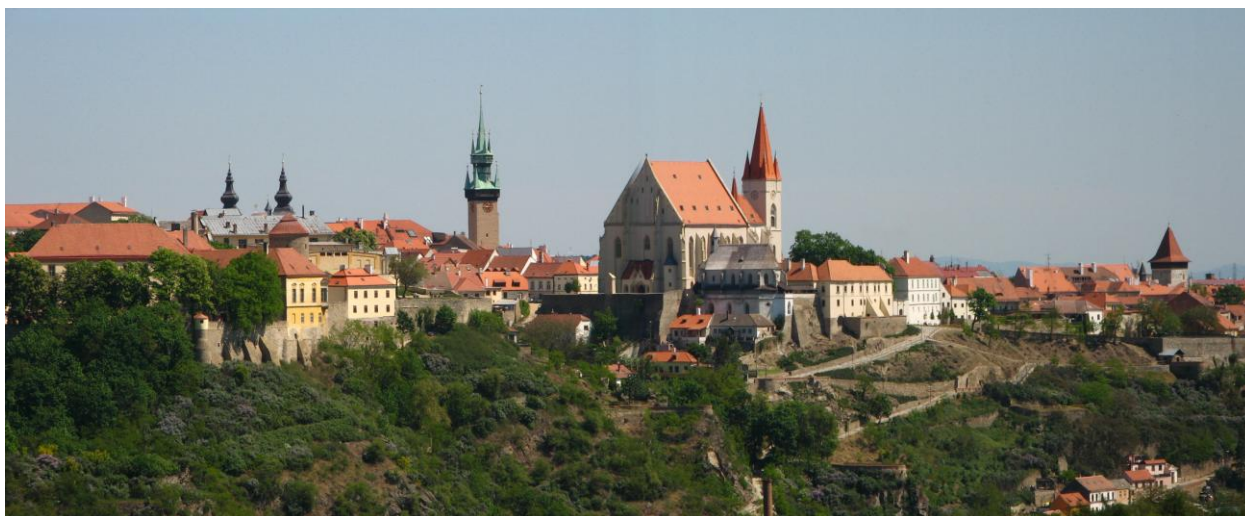
Obr. 3: Znojmo