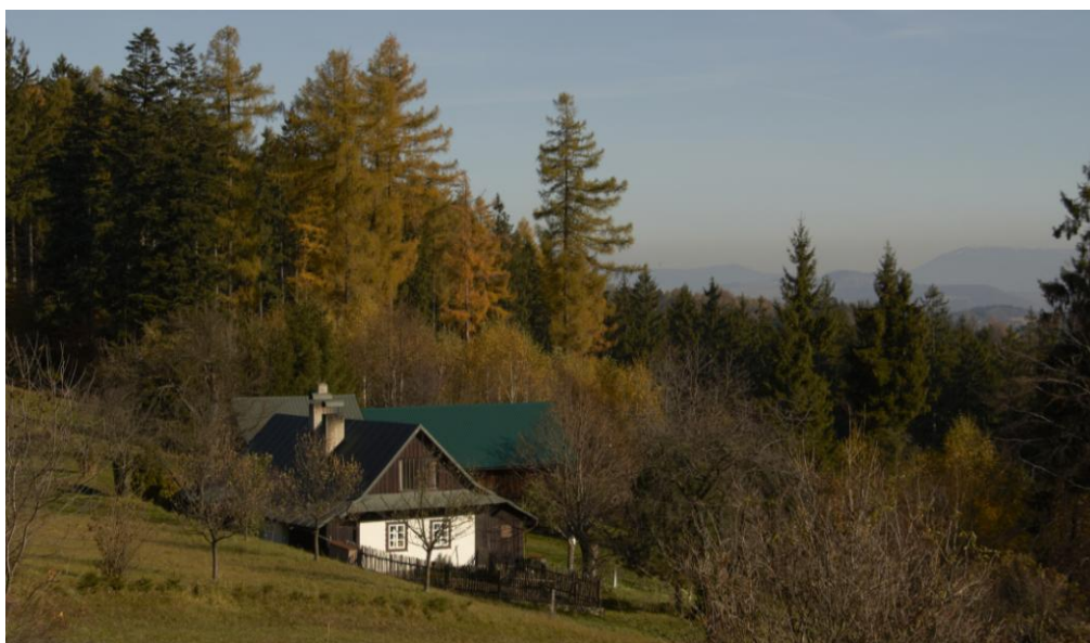
Obr. 4: Rozptýlené osídlení v Karpatech

c) Vytiskněte si plán města a zakreslete do něj podle vámi zvolené legendy urbanistické zóny. O výsledcích diskutujte.