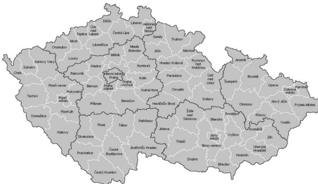
Obr. 2: Kraje v roce 1960

4) V roce 1960 bylo vytvořeno již jen 10 krajů na území celého Československa (z toho na území dnešní ČR 8: Praha, Středočeský, Jihočeský, Západočeský, Severočeský, Východočeský, Severomoravský, Jihomoravský) a 76 okresů (v roce 1996 vznikl navíc ještě okres Jeseník). Došlo také ke slučování některých obcí, takže jejich celkový počet klesl.