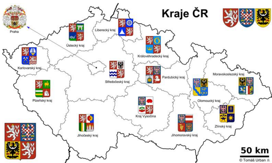
Obr. 3: Současné kraje ČR