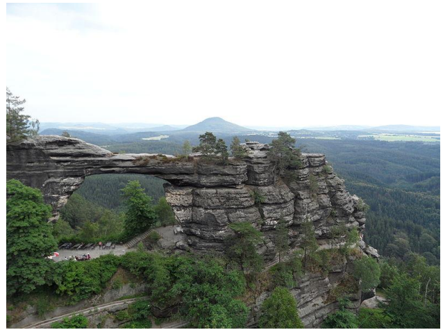
Obr. 1a: Skalní brána v Broumovských stěnách