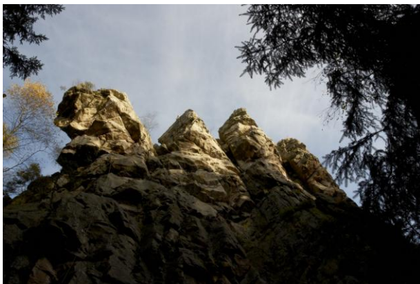
Obr. 8: Čtyři palice