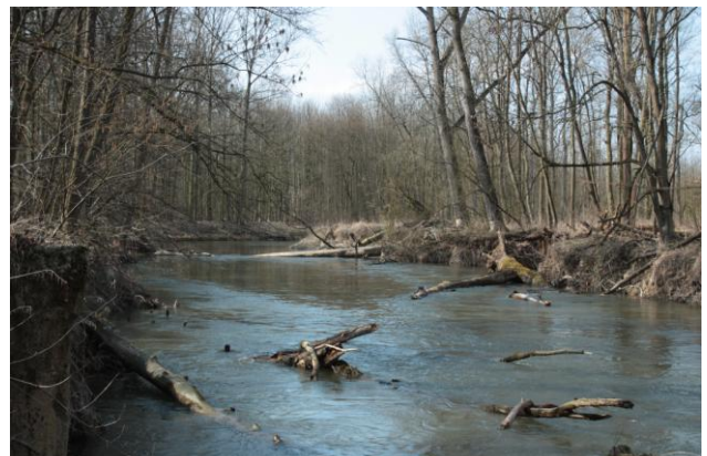
Obr. 9: Řeka Morava

Digitální učební materiál byl vytvořen v rámci projektu Inovace a zkvalitnění výuky na Slovanském gymnáziu CZ.1.07/1.5.00/34.1088