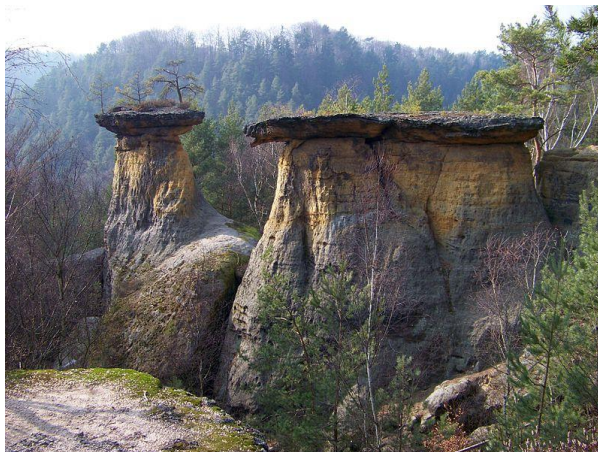
Obr. 2a,b: Mšenské pokličky