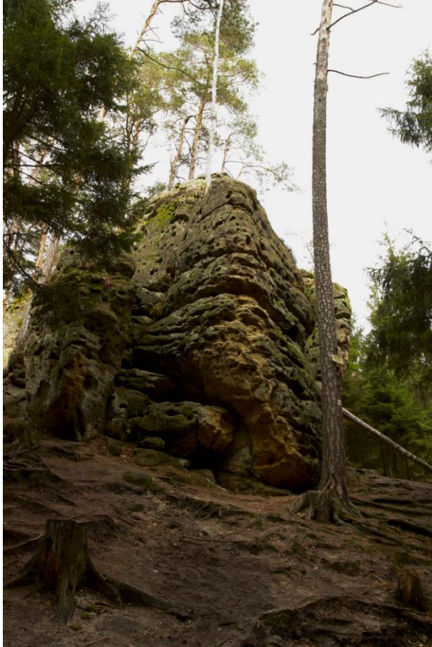
Obr. 6: Toulovcovy Maštale