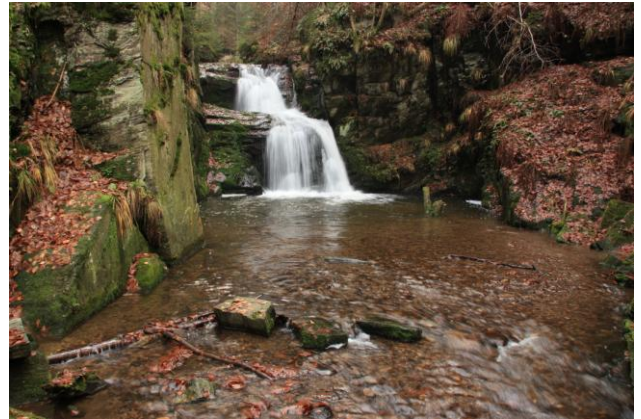
Obr. 4: Řeka Jihlava