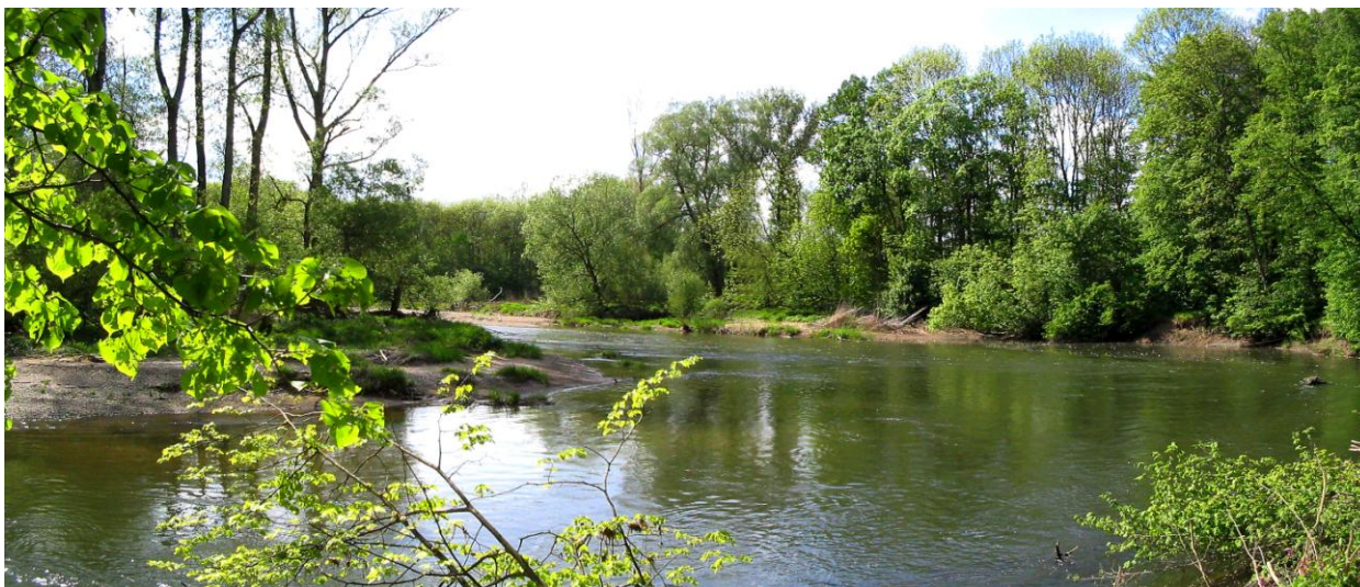
Obr. 3: Řeka Morava

a) Které z těchto tvarů najdeme v Litovelském Pomoraví ? Podívejte se na mapě na přirozeně meandrující tok řeky Moravy . Vysvětlete pojem šířková eroze řeky .