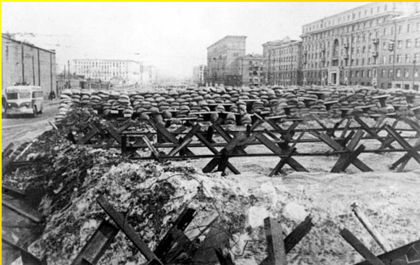
Protitankové zátarasy v Moskvě