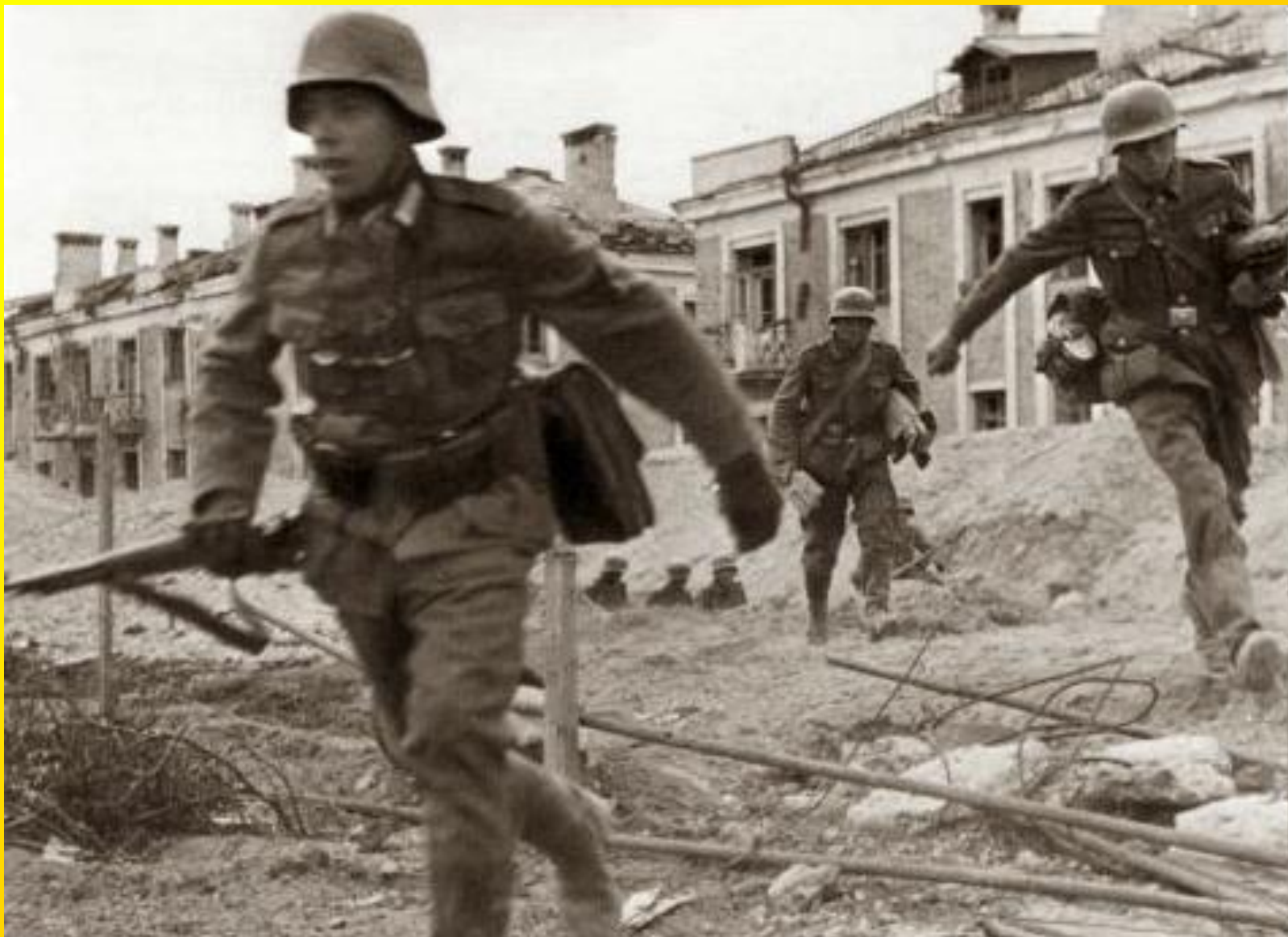
Německé síly postupující ulicemi Stalingradu