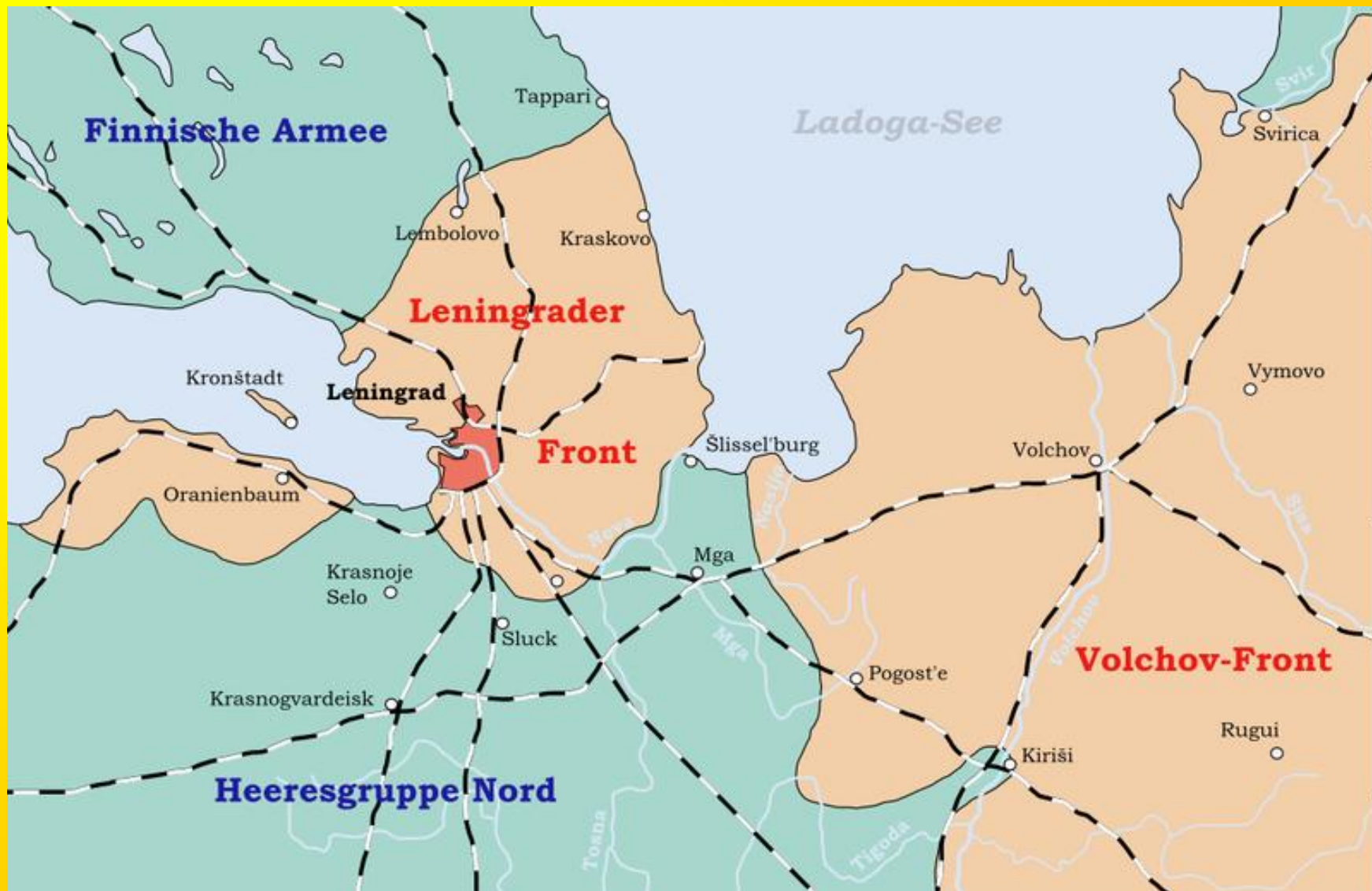
Blokáda Leningradu (květen 1942-leden 1943)