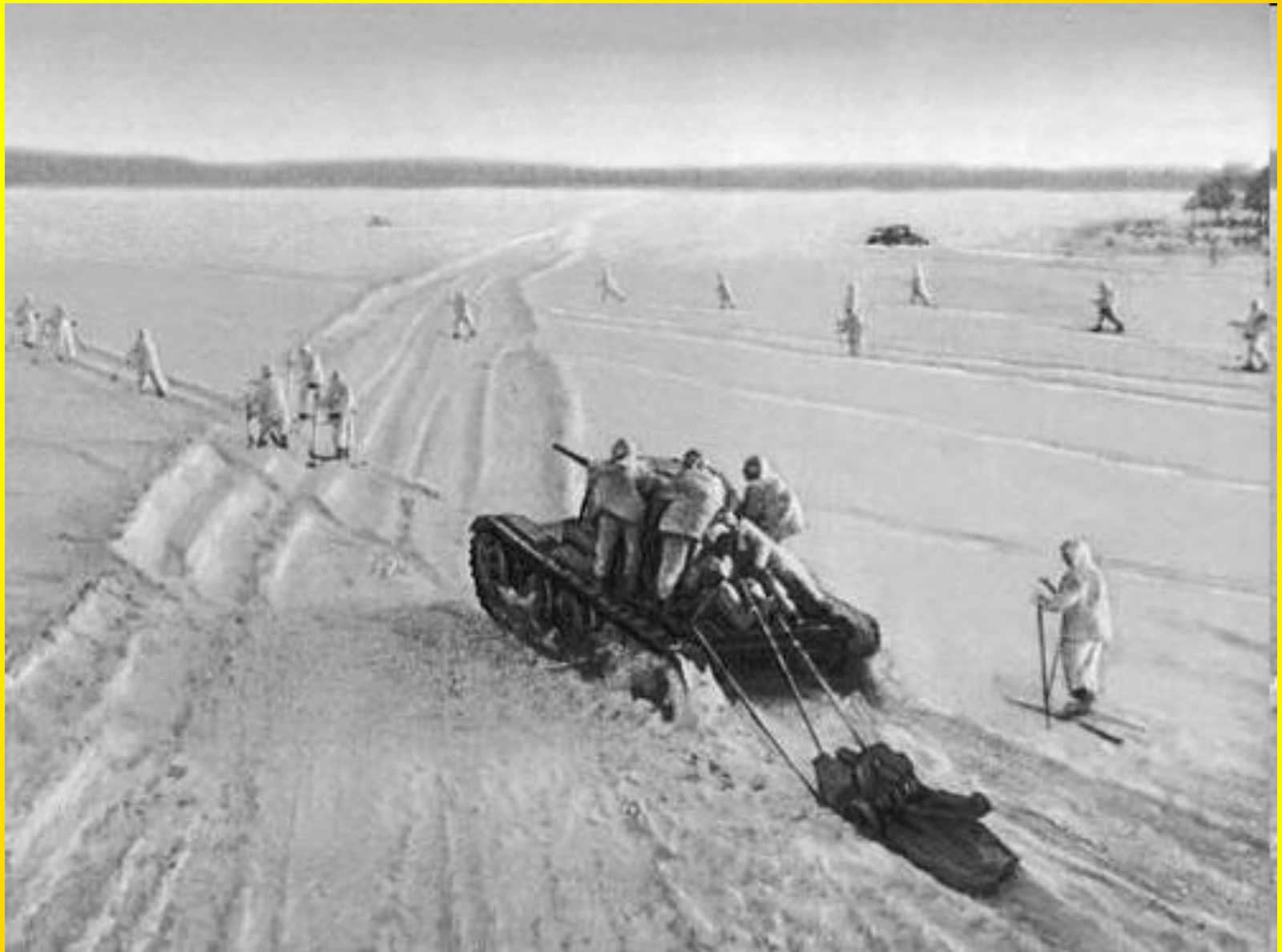
Sovětský protiútok (prosinec 1941)