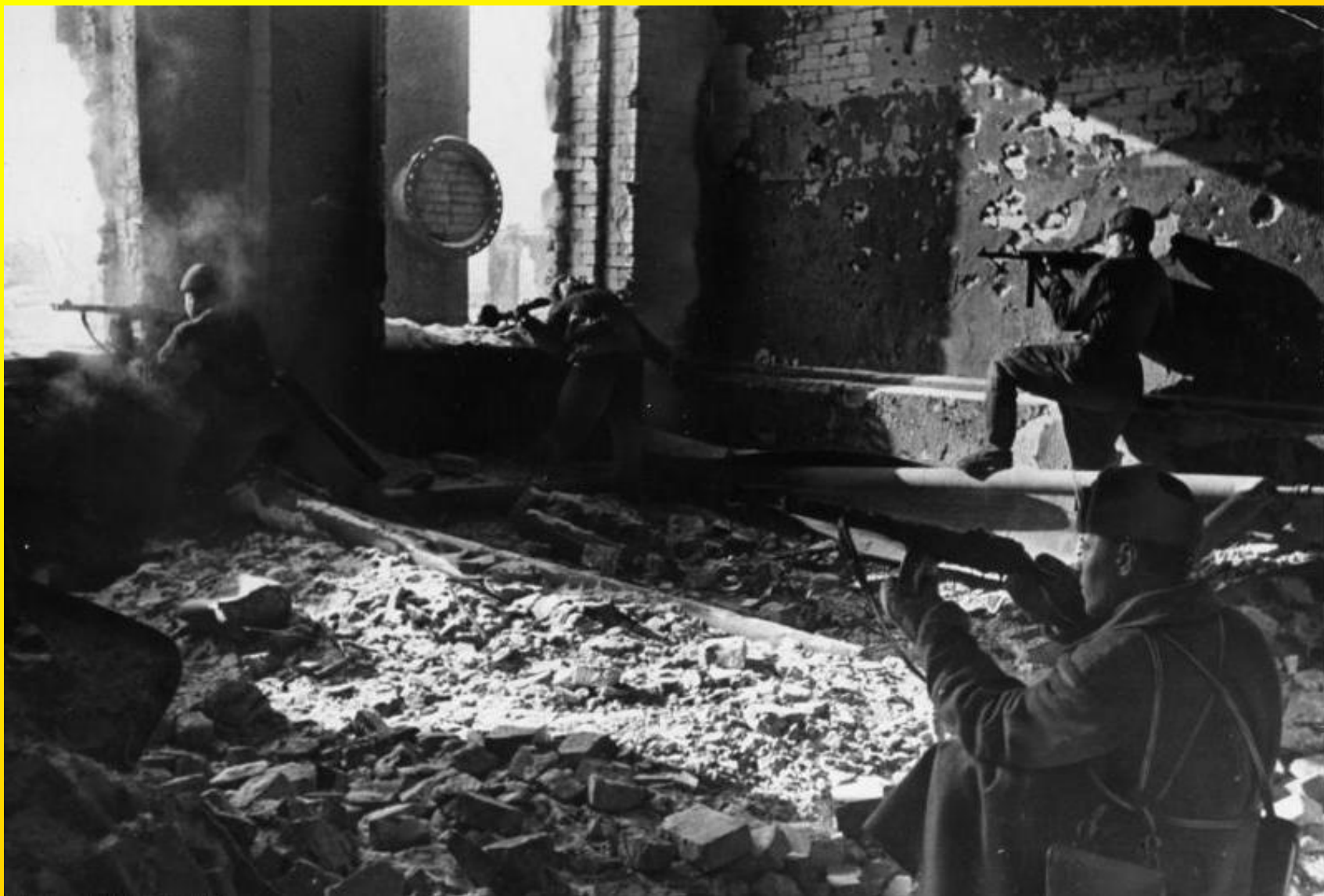
Sovětské pěšáci při krvavém střetu