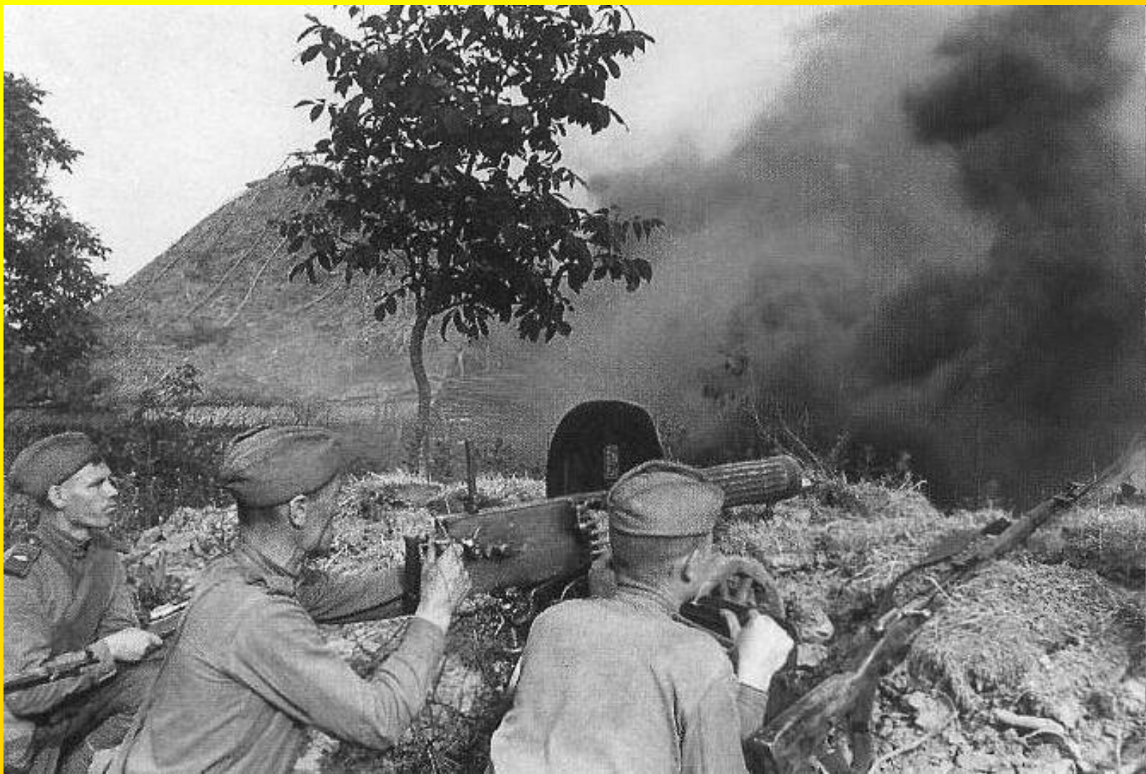
Sovětská kulometná jednotka během bitvy