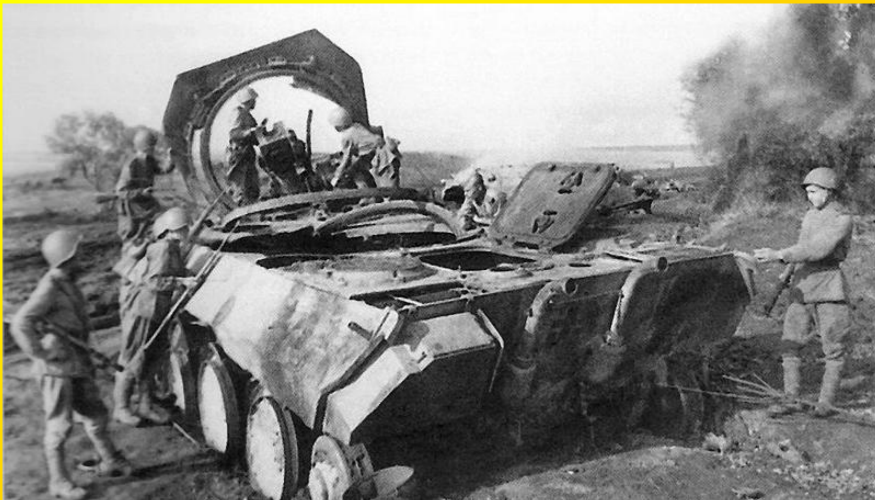
Zničený německý Panther