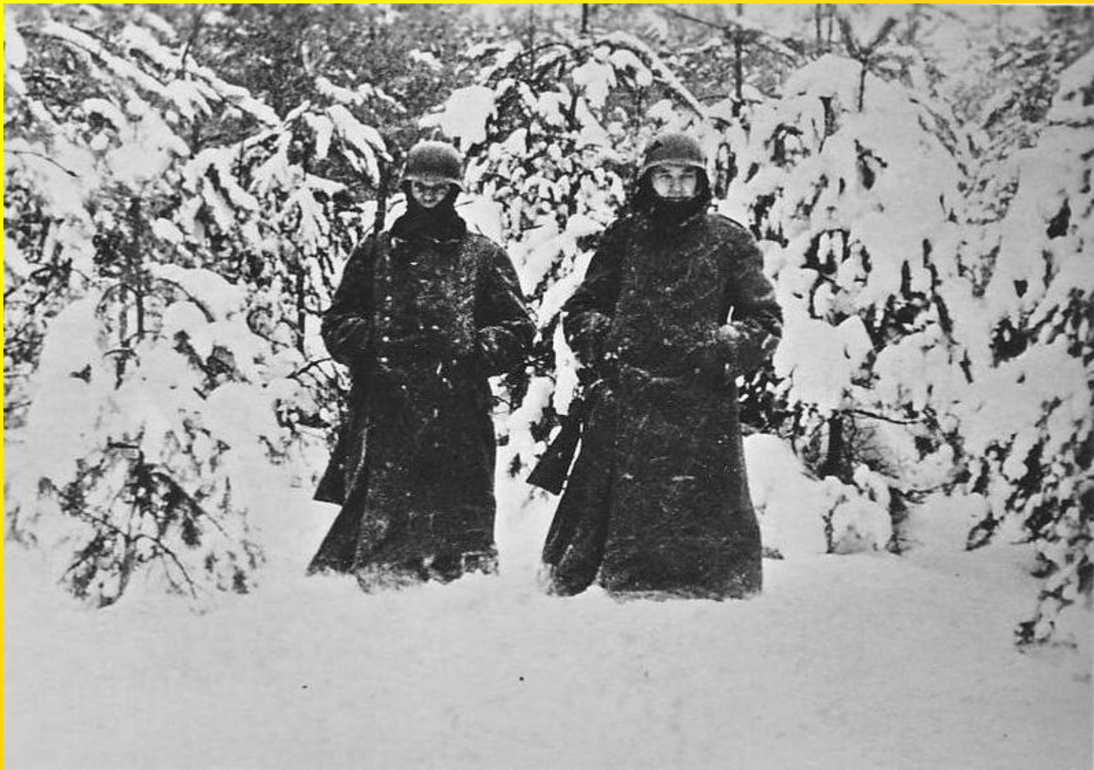
Němečtí vojáci na stráž