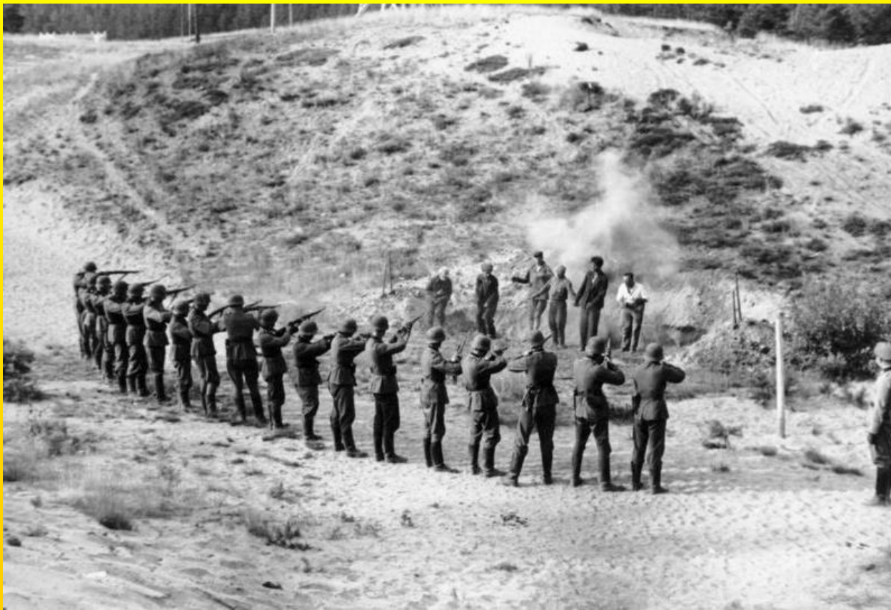
Poprava zajatých partyzánů