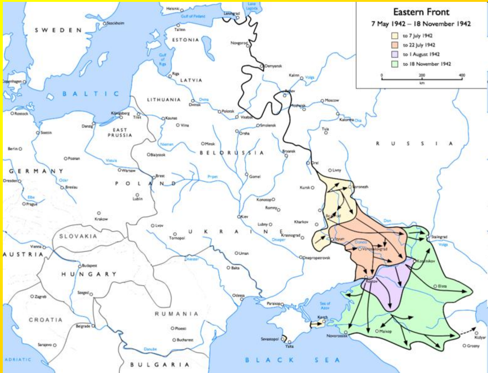
Německý postup od května 1942 do listopadu 1942