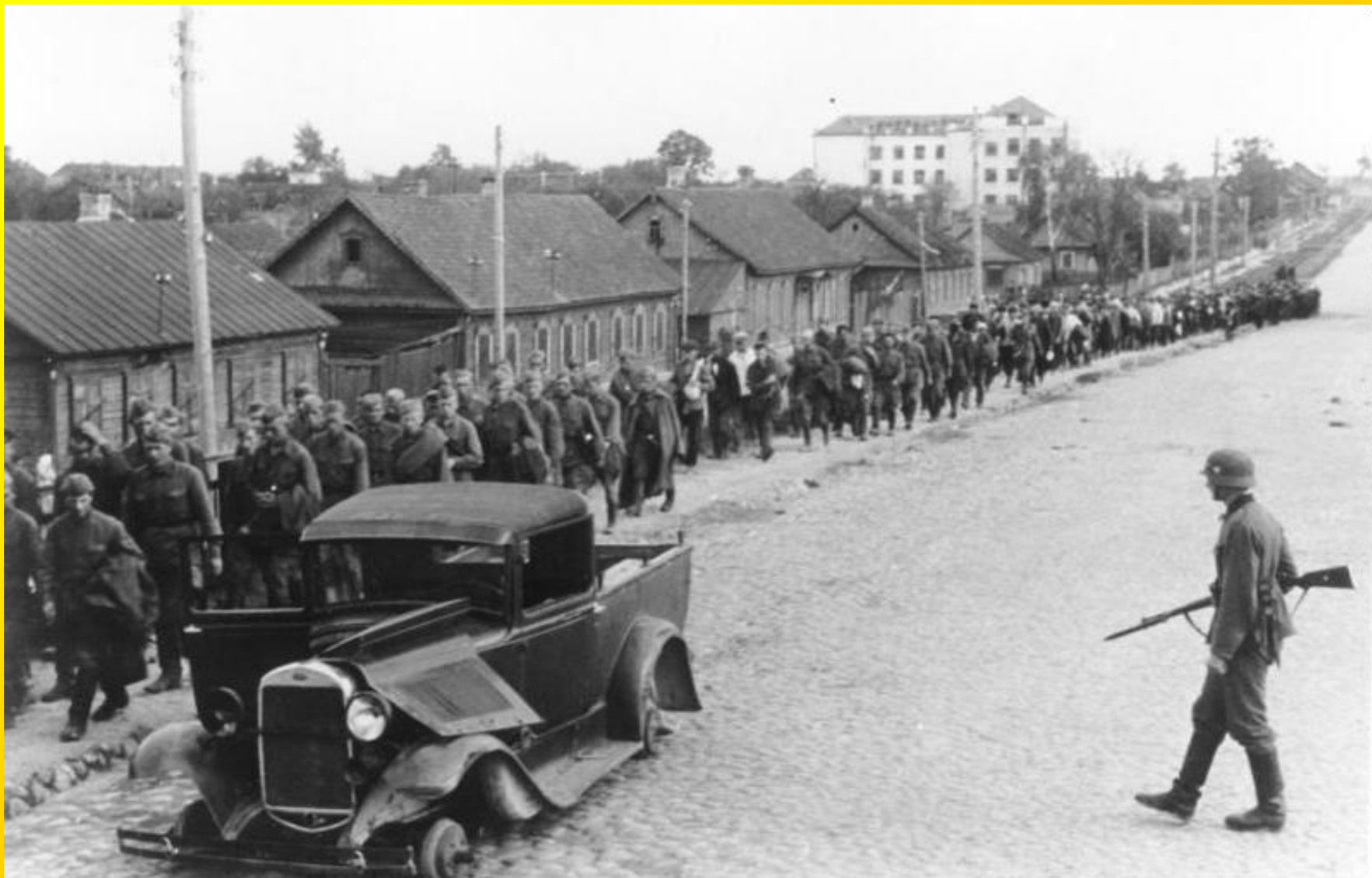
Zajatí sovětští vojáci